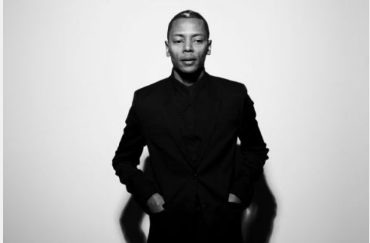
Jeff Mills

Man From Tomorrow nous avait été présenté comme un portrait filmé ; il n'en est rien. Il s'agit en fait plutôt d'une expérience, sonore et visuelle , ou encore d'un long moment à éprouver – au sens premier du terme -. Le qualifier de clip musical serait péjoratif et inadapté, mais c'est pourtant de ce type de vidéos qu'il se rapproche le plus : l'interprétation d'un son et sa mise en forme . Seulement, on ne sait plus bien si c'est l'image qui vient illustrer les différents morceaux, ou ces derniers qui ponctuent des bribes de corps et d'architectures fractionnés au stroboscope. Les deux domaines ne font plus qu'un.